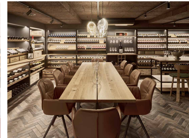
Stilvoll inszeniert – der Weinkeller

Wärme, Natürlichkeit und Behaglichkeit. Im Hotel Laudinella wird die charakteristische Struktur der Arve bewusst in Szene gesetzt und mit dunklem Nussbaum sowie Akzenten in Schwarz und gedeckten Brauntönen kombiniert. Dieses Zusammenspiel schafft eine elegante Balance aus rustikaler Authentizität und zeitgemässer Gestaltung.