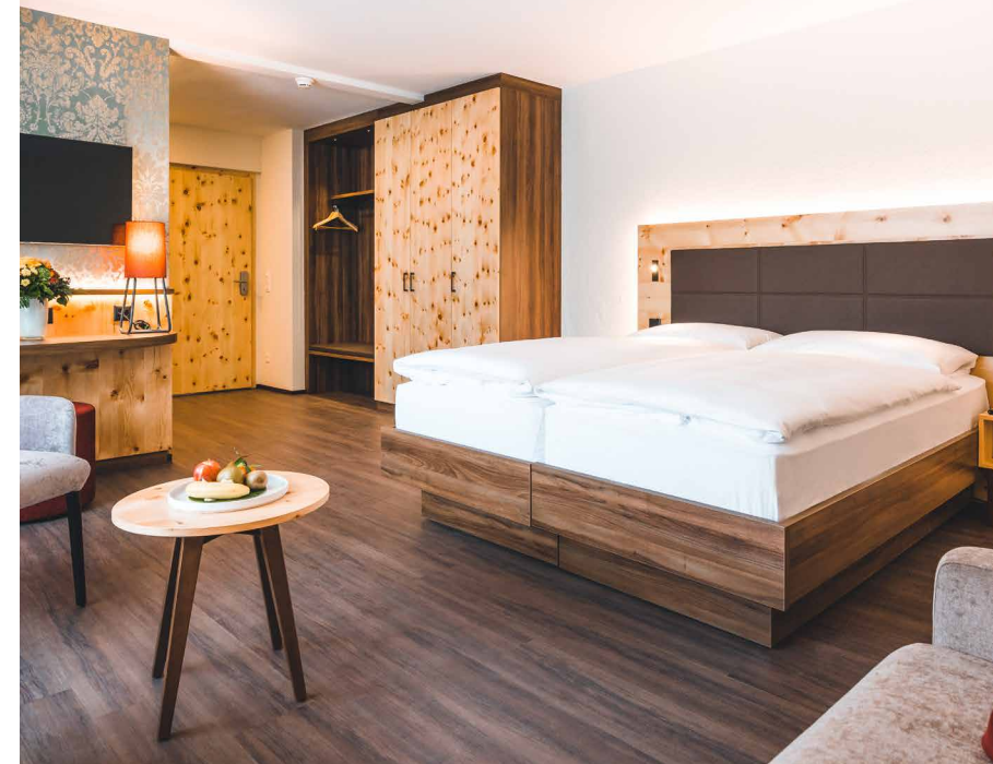
Alpiner Chic mit heimischer Arve

Prägend für das Design ist der Einsatz heimischer Hölzer – allen voran die im Alpenraum traditionsreiche Arve. Seit Jahrhunderten wird dieses Holz im alpinen Innenausbau verwendet und steht für