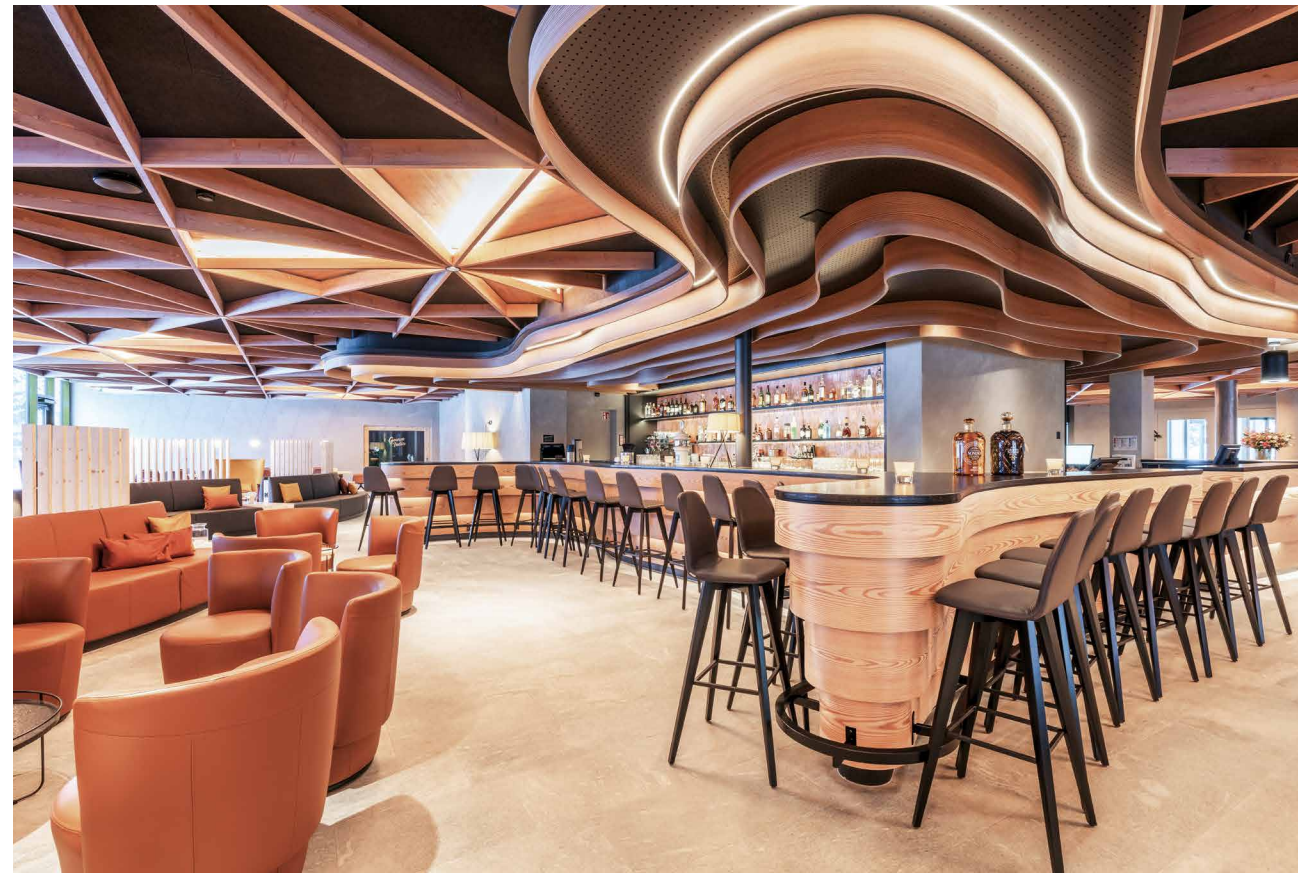
Organische Formen als Leitmotiv